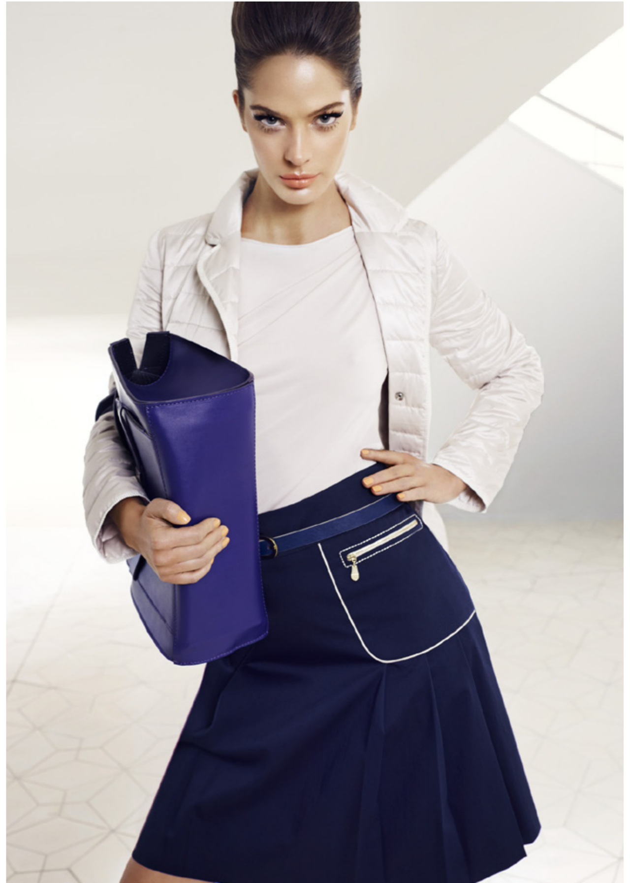
SS 2015 CAMPAIGN